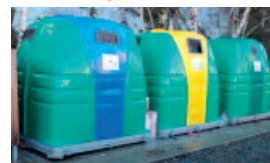
Colonne de tri sélectif de la Croix d'Aubugues.

Nous vous encourageons donc à trier vos déchets afin de réduire le coût du traitement de nos ordures.